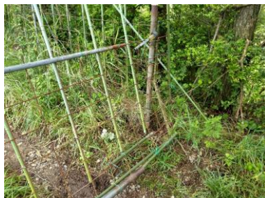
6/20 出入り口を壊して、その下から出入りした様子。