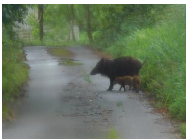
6/19 「下の畑」から「ハウス横」に移動中?の親子イノシシ。このイノシシの顔は、左のとは違っていました。

から、小さな動物が現れました。車を止めて様子を見てみると、今度は右手から大きなイノシシが現れ、その後を数匹の子イノシシが。合わせて5匹の子イノシシが母イノシシとともに、ハウスのある畑に向かって茂みの中に消えていきました。