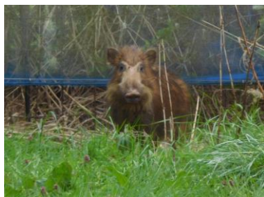
4/15 畑の中にいたイノシシ、上の個体と顔の様子が一緒です。この時は、3匹成獣が入っていました。