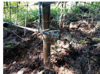
6/22 出入り口の扉を固定している柱を持ち上げて侵入。