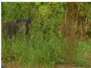
6/20 草むらの中からこちらを窺う母イノシシ(?)