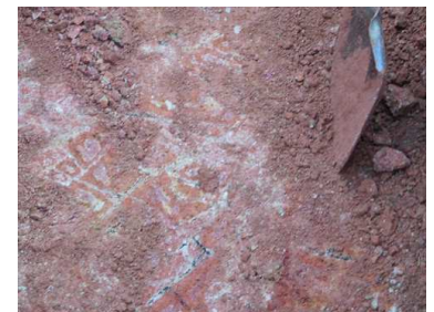
畑を1mくらい掘ったら、硬く白い縞(亀裂)の入った岩が現れます。一部は粘土のようになっていますが、それ以外の部分は硬くてスコップが刺さりません。