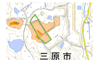
農地造成後、入り組んだ等高線がなくなり、なめらかになっています。緑の枠で囲まれた部分が、私たちの畑です。約3haあります。