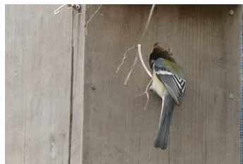
虫を中にいる雌に渡して、すぐに飛んでいきました。

4月中旬になると、巣材を運んでくることはなくなり、抱卵を始めたのか、虫を啜ってやってきた雄(?)が、巣箱を覗き込んで中にいる雌に虫を渡しているようでした。運んでくる虫は、アオムシ、蛾、ミミズなど多様でした。