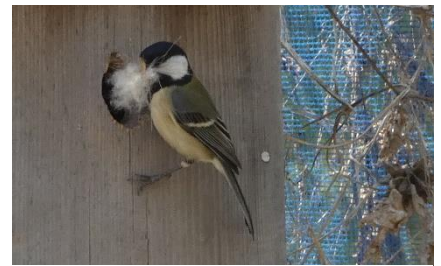
3/31 獣毛のようなふわふわとしたものを運び込んでいます。