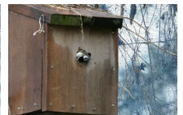
人がいると警戒の声をだして近くの木にとまり、巣箱に近づきません。人気のないことを確認したら、素早く巣箱に入ります。