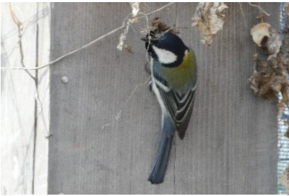
3月4日 先客はシジュウカラ。