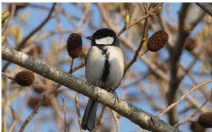
3/7 巣箱の近くで周囲を見渡している姿をよく見かけるようになりました。

3月後半には、巣箱争いは決着したらしく、シジュウカラが盛んに巣材を運び込む姿を見ることができました。