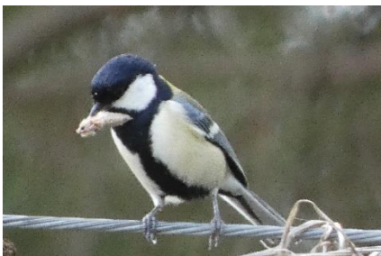
羽のとれた蛾の胴体のようなものを啜ってきた雄